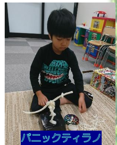
パニックティラノ