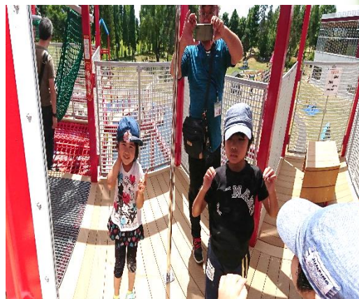
↑細く見える鏡の前で！