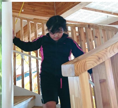
←螺旋階段がステキです。 お姫様になった気分。