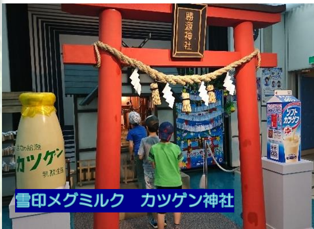
雪印メグミルク カツゲン神社

夏休みの活動 夏休み中にいろはでは沢山の場所にお出かけをしています。土曜日の行事と違い、写真を紹介する機会がありませんでしたので、ここでまとめて紹介いたします。